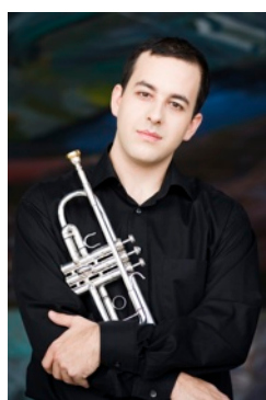
Giuliano Sommerhalder orchestra Gewandhaus GERMANIA