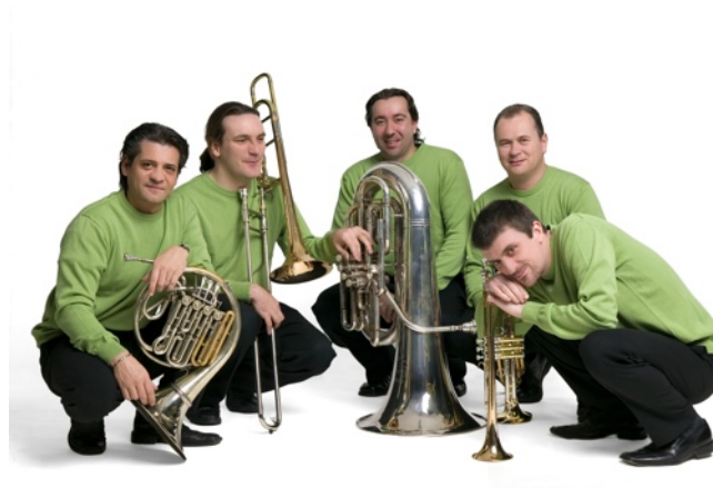
Pentabass Teatro Regio Torino ITALIA