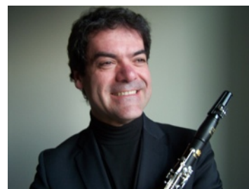
Luigi Picatto Teatro Regio ITALIA