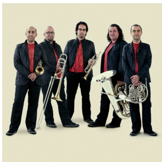
Spanish Brass solisti internazionali SPAGNA