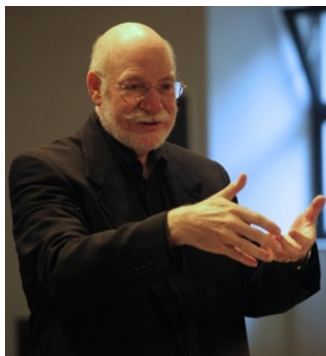
Ronald Romm solista internazionale ex Canadian Brass USA